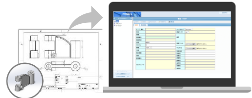
※システム画面イメージ